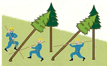
(図2)かかり木の処理

<注意> 「かかっている木の元玉切り」(かかった状態のまま元玉切りをし、地面等に落下させることにより、かかり木を外すこと。)(図5)は、今般の改正により禁止されるものではありませんが、かかり木の安全な処理方法とは言えないことに留意してください。