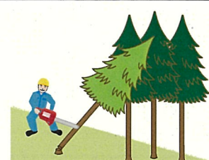
(図5)かかっている木の元玉切り