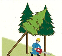
(図3)かかられている立木の伐倒