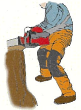
（図7）下肢の切創防止用保護衣

〈注意1〉（図7）で例示した下肢の切創防止用保護衣は、前面にソーチェーンによる損傷を防ぐ保護部材が入っており、JIS T8125-2に適合する防護ズボン又は同等以上の性能を有するものを使用してください。また、労働者の身体に合ったサイズのもを着用してください。既にソーチェーンが当たって繊維が引き出されたものなど、保護性能が低下しているものは使用しないようにしてください。