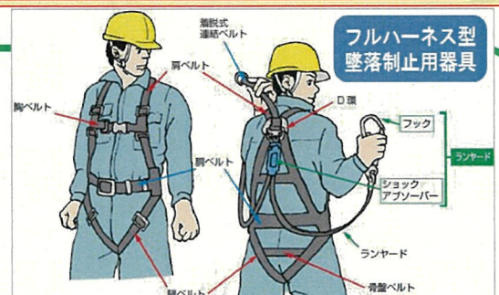
フルハーネス型 墜落制止用器具