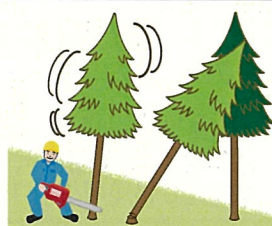
(図4)かかり木に激突させるためにかかり木以外の立木の伐倒