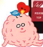
高知県依存症キャラクターのうのうくんとはあとりちゃん

「高知県メンタルヘルスサポートナビ」は、悩みを抱えたあなたや、周りで支える方々をサポートする